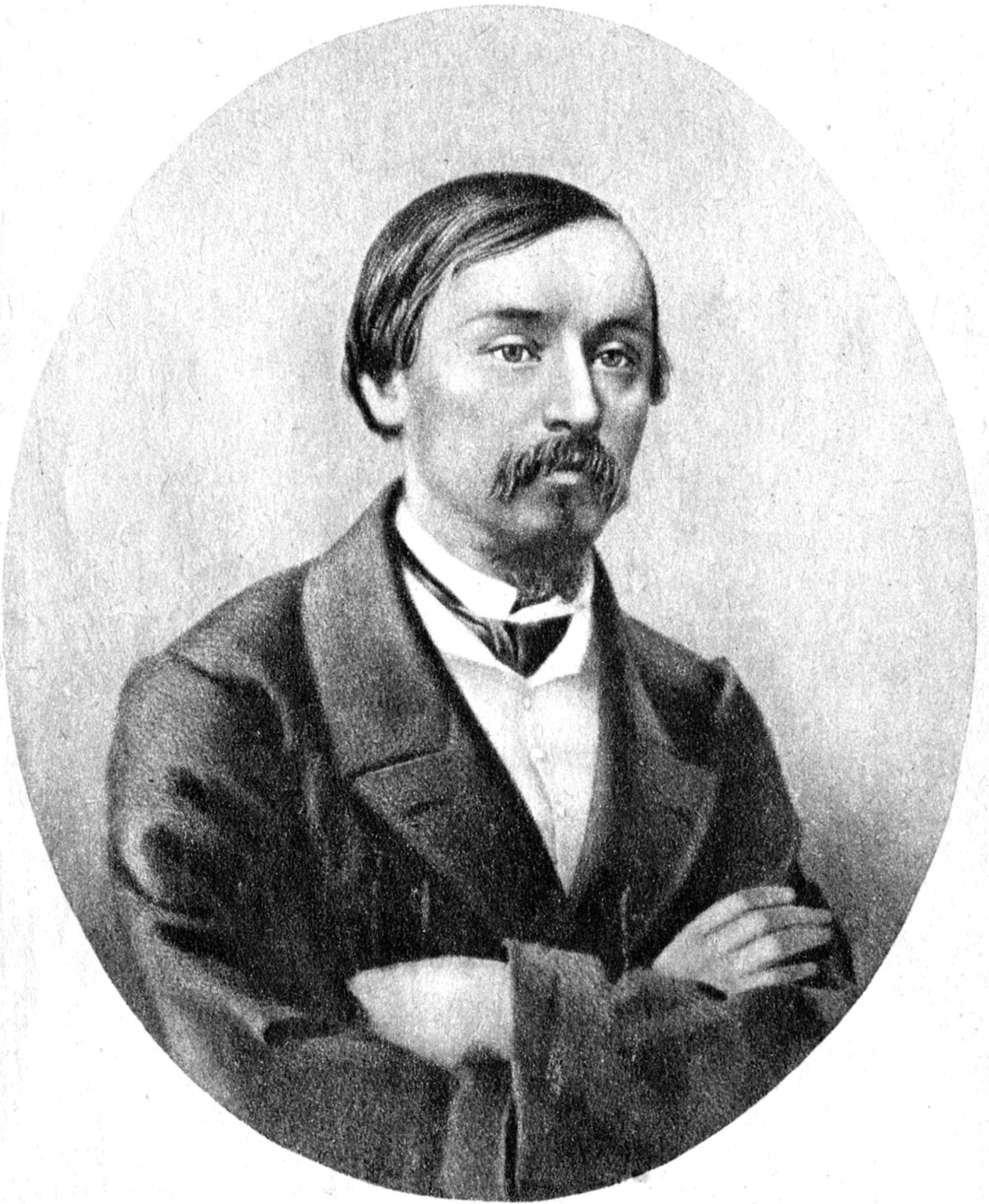
Н. А. НЕБРАСОВ.

Рисунок неизвестного художника (1850-е годы).