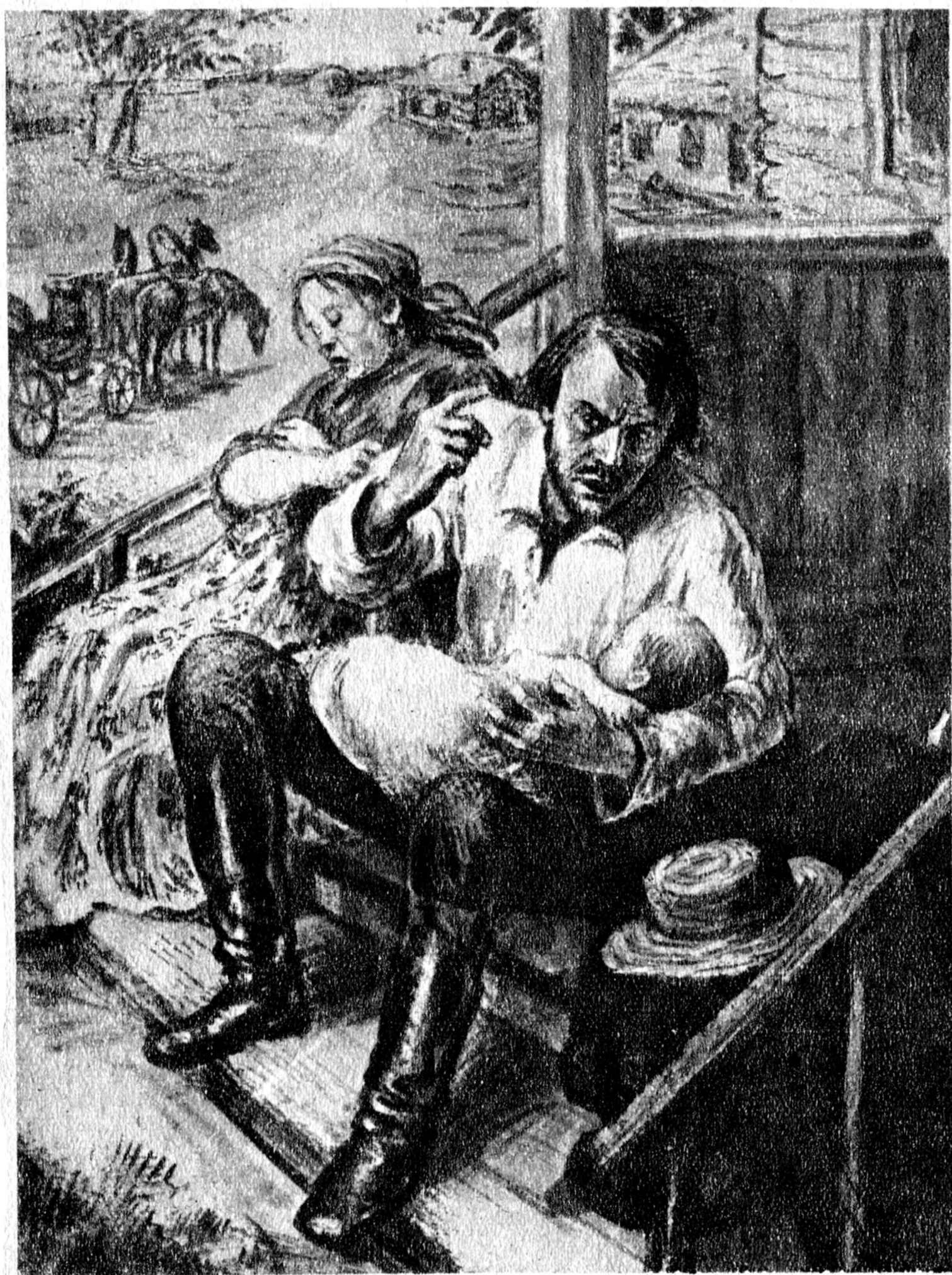
Рисунок А. Давыдовой.