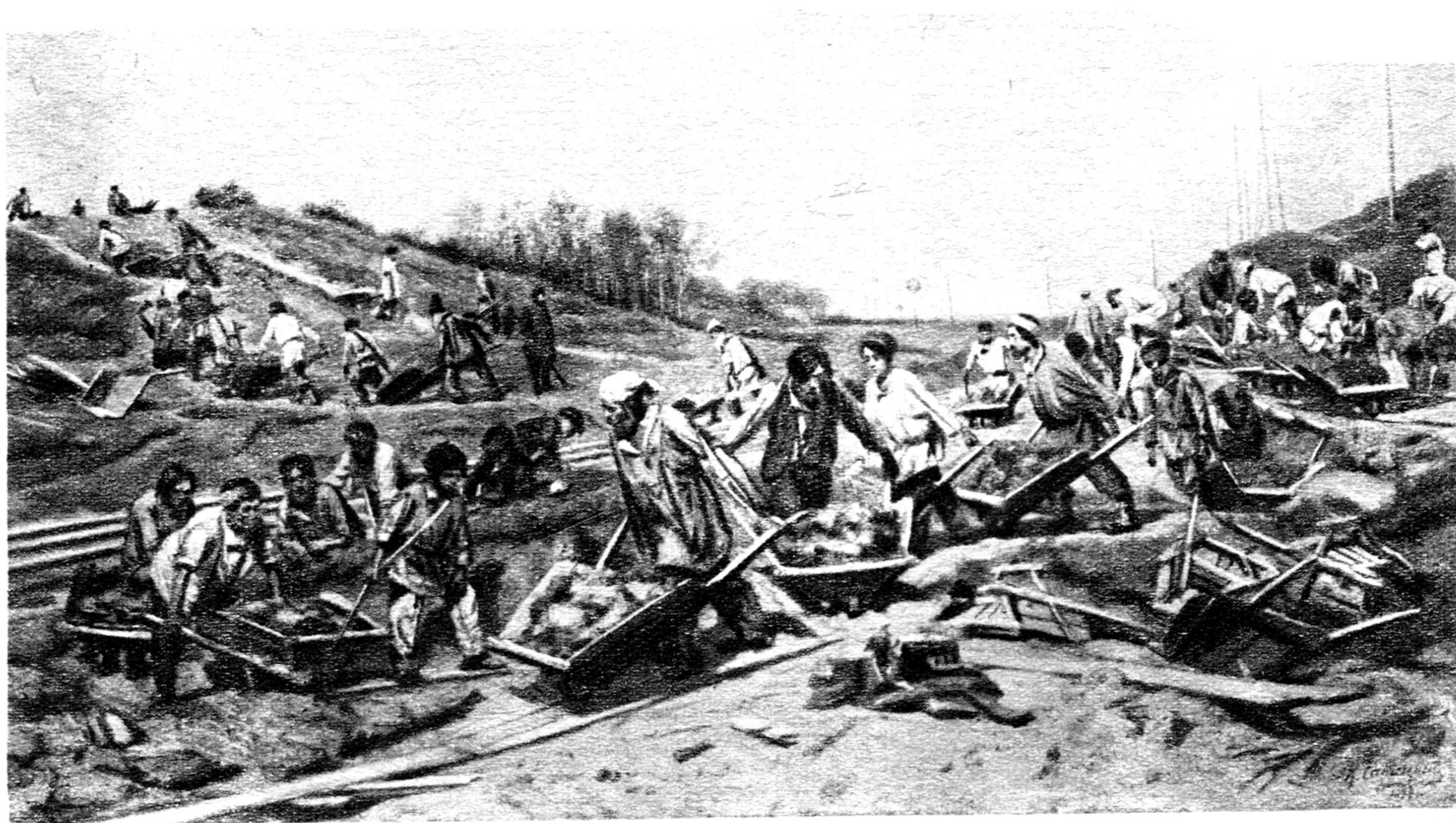
«Ремонтные работы на железной дороге».